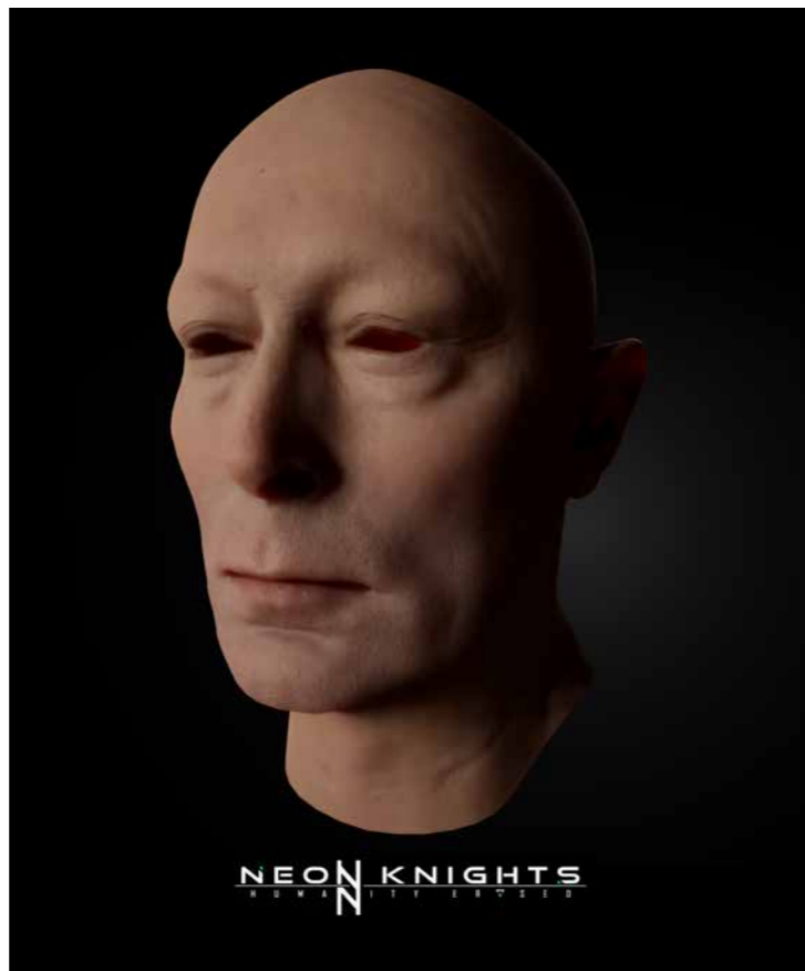
Lars Mikkelsens digitale dobbeltgænger.

"Hollywood har i mange år forsøgt at få CGI-effekterne (computer-genererede billeder, red.) til at se så realistiske ud som muligt. Og den største udfordring har altid været at designe digitale mennesker. I film som 'Polar Ekspresen' fra 2004 kom de digitale udgaver af skuespillerne til at fremstå livløse og zombie-agtige. Men nu er teknologien blevet så god, at man næsten ikke tænker over det mere," siger han.