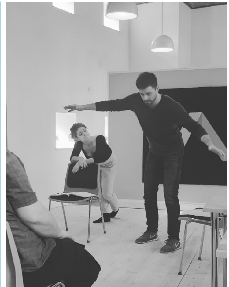
Æ Teater.

Teater Partner in Crime er et Københavnsk baseret teater, stiftet i 2015, med fokus på ny dansk dramatik og en vision om at få flere unge til at gå i teatret. Her er målgruppen 18-30 år, og måden at nå