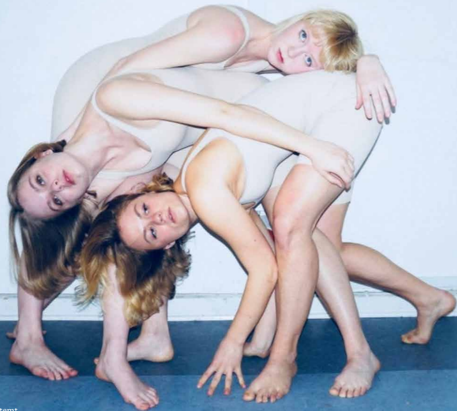
Teater Ubestemt.

I dag er segmentet “unge” blevet en mere broget skare. Hvor der for ti-tyve år siden var én slags forestillinger for teenagere og en anden for voksne, er der i dag mere glidende overgange i medie- og underholdningsforbruget. Forældre, børn og bedsteforældre kan se samme serier på Netflix, høre den samme musik eller de samme podcasts. Tendensen gør sig også gældende hos de teatergrupper, der laver teater for de unge. Sceneliv har talt med en ekspert i publikumsudvikling og har spurgt tre teatergrupper for unge, hvordan de tænker målgruppen ind i deres forestillinger.