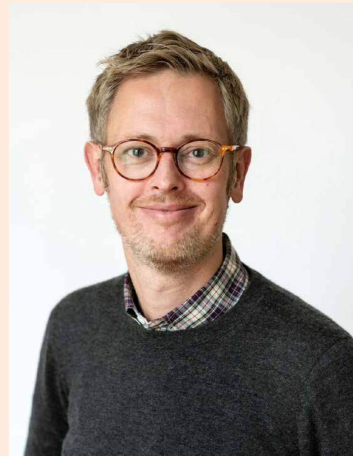
Mads Meier Jæger.

Der er dog ikke tale om en 1:1-reproduktion af forældrenes fagvalg. Verden ændrer sig, og børn af skolelærere søger for eksempel