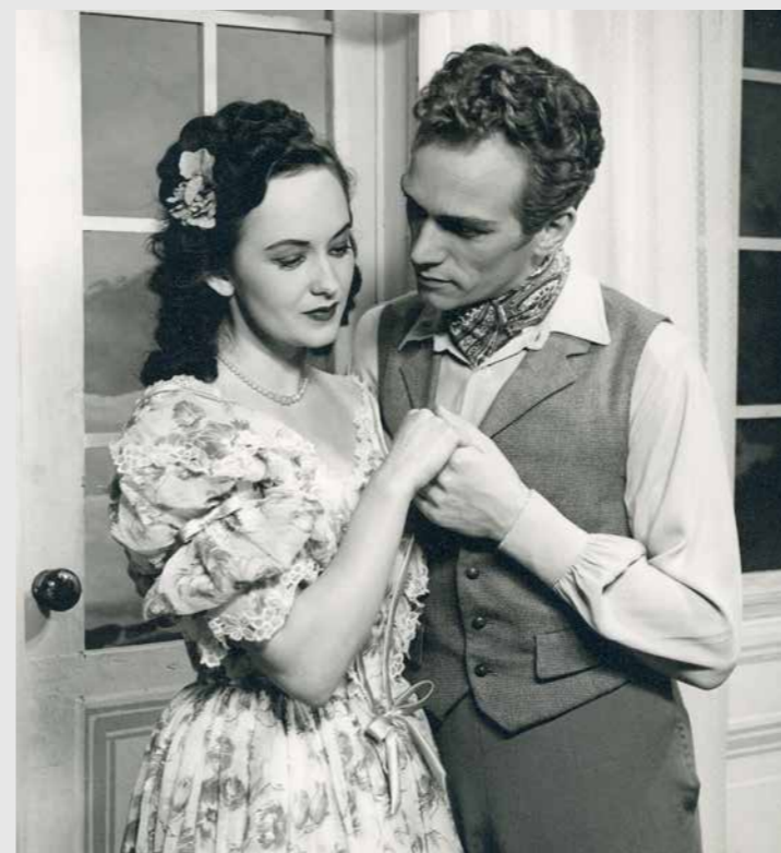
Holger Perfort i teaterstykket 'Landmandsliv' (1952-1953).

Holger Perfort var kendt for sin rappe replik og sit lyse sind.