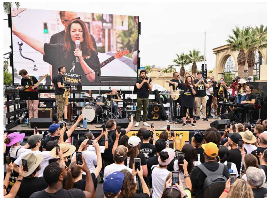
SAG-AFTRAs strejke fik global opmærksomhed.