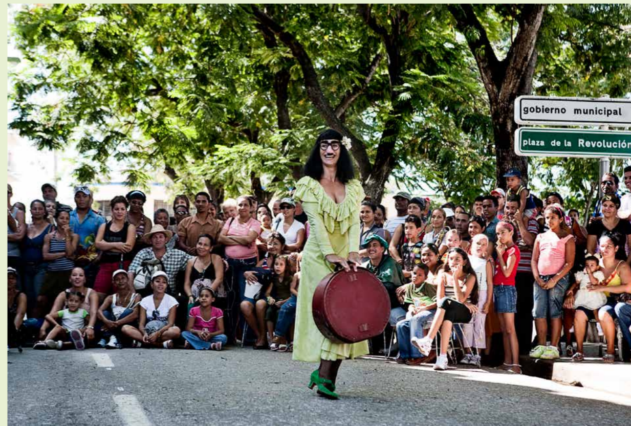
Batida i Cuba.

“Det gælder specielt, når du tager til de lande, du normalt ikke kommer til. Vi i Batida har det princip, at vi så vidt muligt vil dele vilkår med arrangørerne. Hvis de ingen penge har, skal vi heller ikke have nogen. Men hvis det er en velhavende festival, vil vi selvfølgelig også gerne have en bid af kagen. Vi ser vores internationale aktiviteter som en integreret og nødvendig del af vores teaterdrift. Og en del af lønnen er at stå i Amazonas og spille teater for nogle fantastiske og betydningsfulde mennesker, der desværre ingen penge har. Men hvor vi møder langt større entusiasme og kærlighed – også til teatret – end på en stor, supertjekket, velhavende europæisk festival.”