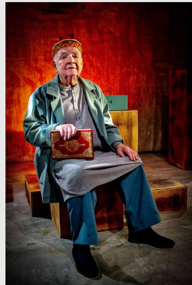
'Monsieur Ibrahim og koranens blomster'.