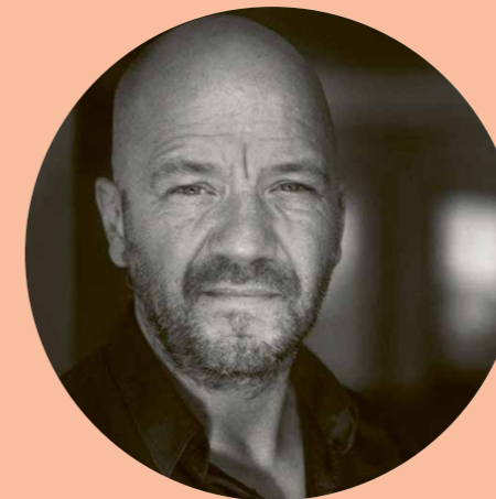
Af Benjamin Boe Rasmussen

Det har længe været et kendt issue, at de unge i vores branche ofte føler det at blive færdiguddannet som en ny optagelsesprøve – simpelthen fordi branchens hoveddør kan være meget svær at slå ind, når du står med et helt nyt og meget kort cv. Ikke mindst inden for scenekunsten, hvor der ikke bliver castet på samme måde som i film- og tv-branchen. Debatten kører på skolerne, både herhjemme og i udlandet. Og derfor sætter Sceneliv i dette nummer fokus på det at være ny i et svært fag som vores – hvordan de unge oplever branchen, hvad de gør for at holde sig i gang, og hvilke tiltag de ser som mulige løsninger.