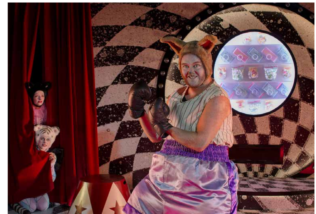
‘En kænguru som dig’ blev mødt af protester og boykot, da Hils Din Mor besøgte Færøerne.