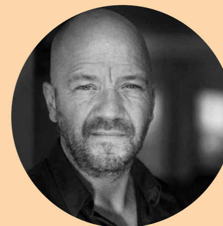
Af Benjamin Boe Rasmussen

D e danske musicals har, siden jeg blev uddannet engang før De puniske krige, gennemgået en kæmpe udvikling – noget du kan læse om i dette nummers store tema om musical i Danmark. Over 10 sider fortæller performere, en forsker og forbundets chefforhandler om, hvad den udvikling har betydet både på og bag scenen – og af både positive og negative ting for jer performere.