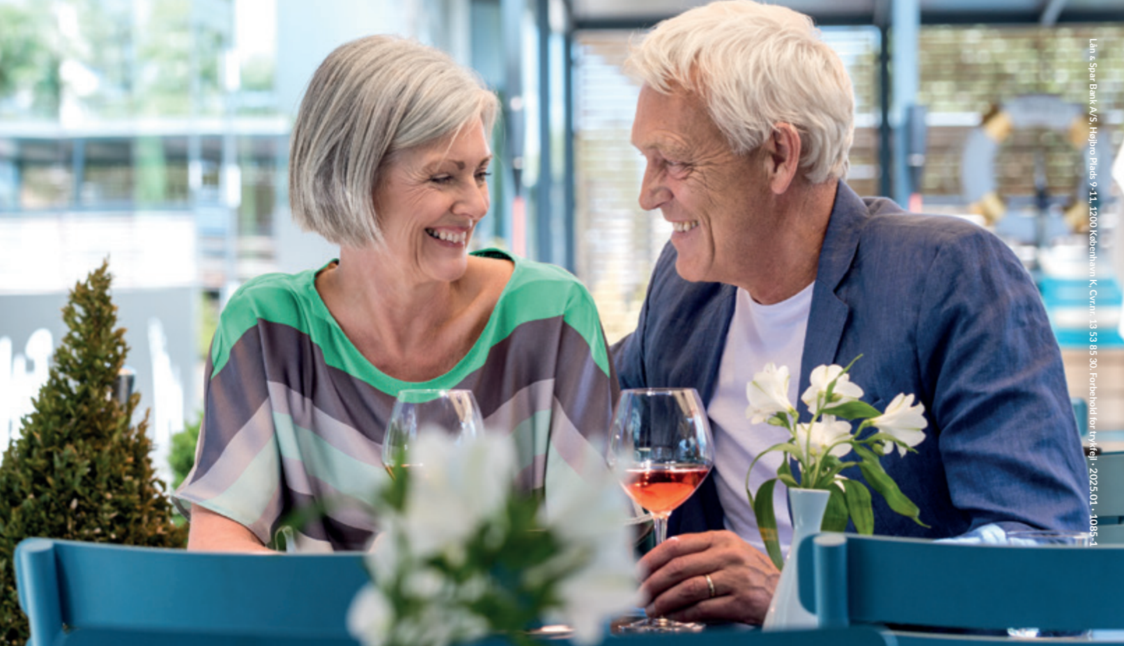
Lån & Spar Bank A/S, Højborg Plads 9-11, 1200 København K, Cvrnr. 13 53 85 30, Forbehold for trykfejl - 2025.01 - 1088-1