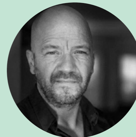
Af Benjamin Boe Rasmussen

Vores tema fortæller en flok af vores medlemmer om at producere selv. Om at tage initiativ, være entreprenant og selv svinge taktstokken i et fag, hvor vi kæmper om publikums og branchens gunst. Udover at jeg synes, det er helt enormt sejt, at I brænder på den måde, får det mig også til at tænke over, at vi i de situationer pludselig selv skal være arbejdsgivere for vores kolleger – og at der følger både ansvar og privilegier med den rolle. Privilegiet og glæden ved at skabe job til andre, men også ansvaret for at etablere økonomisk bæredygtige arbejdsvilkår.